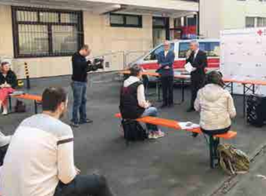
Das DRK und die Stadt Frankfurt stellen ein Projekt vor, in dessen Rahmen über 3.000 Corona-Tests in Einrichtungen der stationären Altenpflege durchgeführt wurden.