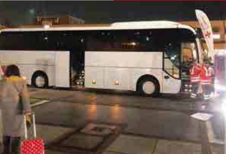
Bereits Anfang Februar standen die Helfer*innen des DRK am Flughafen Frankfurt bereit, um Reisende aus China im MAC in Empfang zu nehmen und zu betreuen.